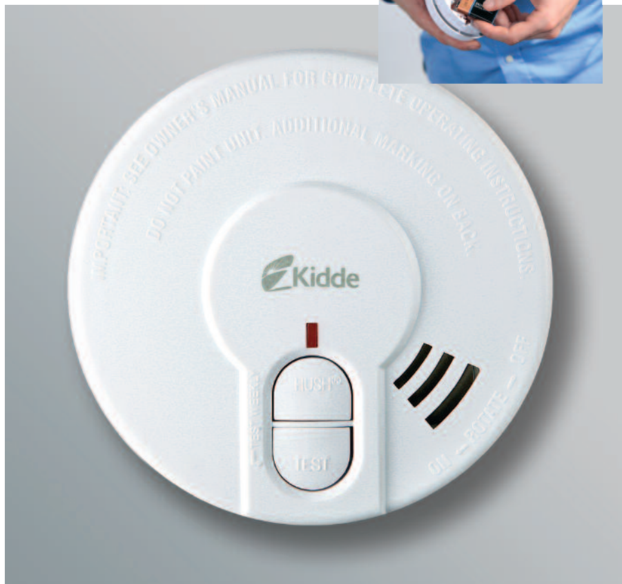
Abb. = 29 HD-L / 29 HD