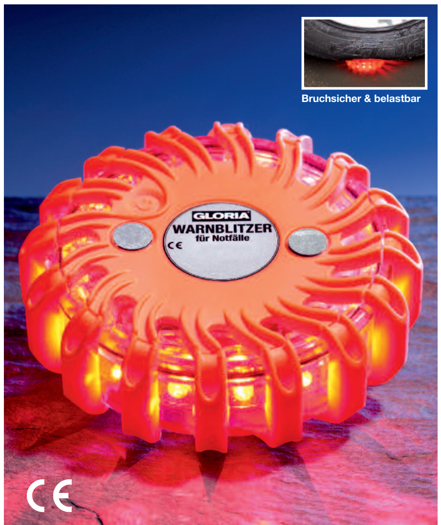
Abb. GLORIA Warnblitzer