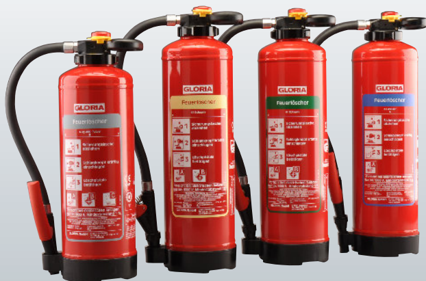
Pulver Schaum Öko-Tipp Wasser