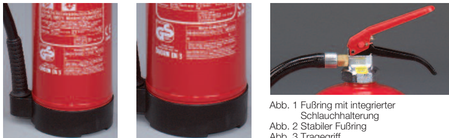
Abb. 1 Fußring mit integrierter Schlauchhalterung Abb. 2 Stabiler Fußring Abb. 3 Tragegriff